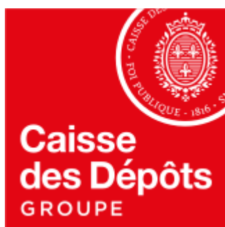
Schéma pluriannuel d'accessibilité 2021 – 2023 Plan annuel 2022